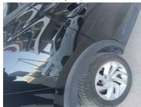
Aile arrière droite (Rayure)