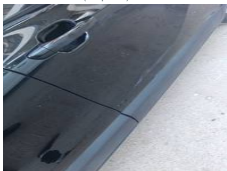
Porte avant droite (Impact)