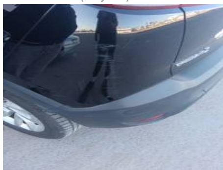
Bouclier arrière (Rayure)