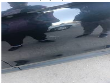
Porte arrière gauche (Rayure)